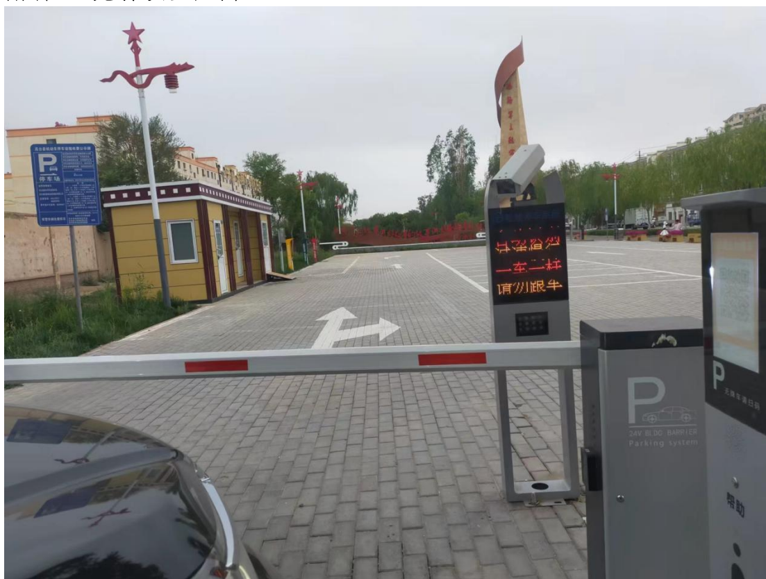
附件 4: 现场核查照片