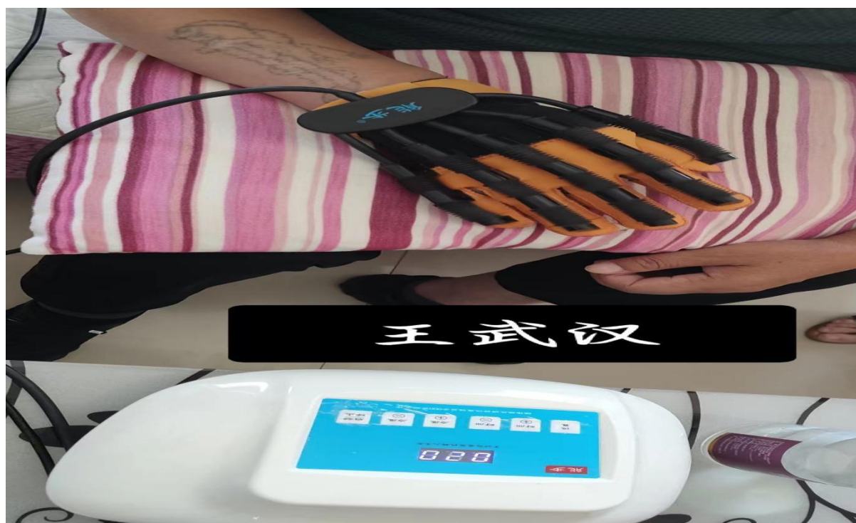
附件 4：现场核查照片